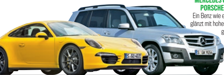
MERCEDES GLK (Typ X204) PORSCHE 911 (Typ 991)

Ein Benz wie eine Burg: Der GLK glänzt mit hoher Qualität. Genauso gut ist der Porsche 911 – nur 2,1 Prozent erhebliche Mängel, aber weniger Laufleistung.