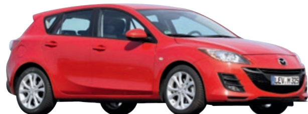
MAZDA 3 (Typ BL)

Der Golf von Mazda zeigt sich im reiferen Alter robust und zuverlässig: Erhebliche Mängel sind mit 6,8 Prozent weit unter dem Durchschnitt.