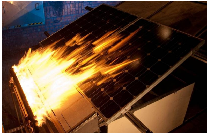
Abb. 1: Spread of Flame Test

Bei der Spread of Flame Prüfung werden insgesamt drei Module benötigt. Hierbei werden die Module sowohl einzeln als auch nebeneinander als Paar geprüft. So soll auch z. B. ein möglicher Spalt zwischen zwei Modul- bzw. Rahmenteilen brandtechnologisch bewertet werden können. Zur Montage der Module auf dem Teststand wird die vom Modulhersteller angegebene Montageart mit entsprechendem Montagematerial verwendet.